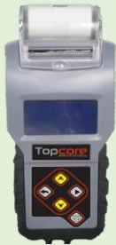
Comprobador de Voltaje