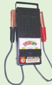
Comprobador de Descarga